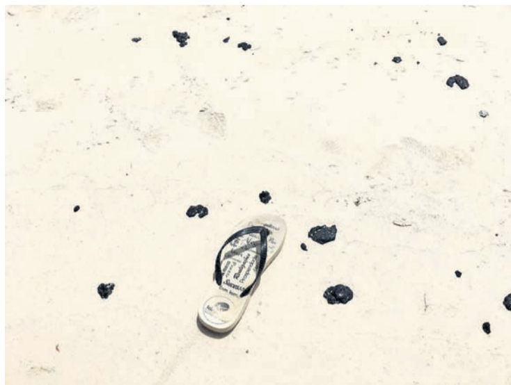
Parti di costa oost di Bonaire, cerca di Sorobon, ta contam-

Desde cu un derame di petroleo di un barco cu a kenter a keda mira pa wardacosta di Trinidad & Tobago dia 7 di februari, el a mancha di preto e beachnan di e nacion Caribense, y ta menasando otro paisnan incluyendo Bonaire, cual su fuente principal di entrada ta turismo.